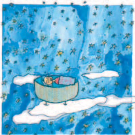
Dejlig er den himmel blå.

karakter, en lyd, som ikke kan overhøres. Man skal øve sig på at læse dem rigtigt, så de ligger godt i munden. Man kan evt. afprøve flere måder at gøre det på, sidde ned, stå op, skifte plads og den slags. Man skal koncentrere sig om sådanne ydre variationer, for ikke at blive forstyrret af sit hjerte, om man nu mener noget med det eller ej. Forståeligheden af Jesu ord kan man også lade ligge en tid, for den kan komme med højtlæsning nummer to eller tre eller med alderen.