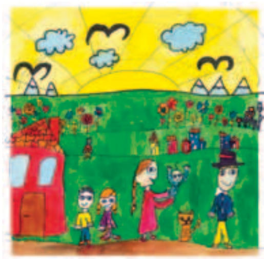
I østen stiger solen op.

Der er altså inspiration at hente først og fremmest i kristendommens egen historie. Folkekirkens præster (incl. undertegnede) kunne f.eks. minde sig