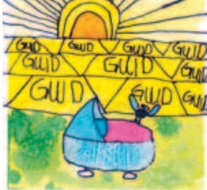
Morgenstund har guld i mund.

Hvordan et gudstjenstligt ritual så skal se ud står altid til diskussion. Det har ændret sig i historiens løb alt efter, hvad der var brug for, og hvordan mennesker har forstået sig selv i lyset af kristendommen. I hovedsagen går ritualet tilbage til pave Gregor d. Store (540-