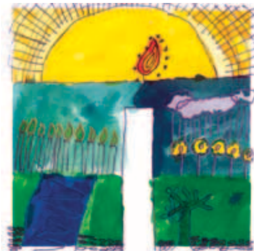
Den signede dag med fryd vi ser.

Det svarer til, at vi nedbryder noget af det, vi synes, vi har bygget op, men som ikke duer til noget. Vi må gå tilbage til Jesu ord om de falske profeter, og til den konsekvens som Paulus drog, at vi er Guds børn i kraft af den ånd, vi får, og den vil sætte os i stand til at skelne mellem sandt og falsk, mellem godt og ondt og dermed også i stand til at skelne de falske profeter fra de sande. Vi må sandsynligvis hver især lægge noget bag os for at kunne tage Jesu ord til os, uden