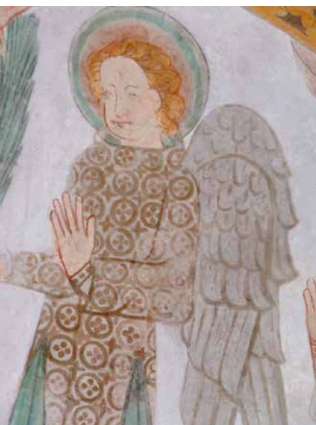
Kalkmaleri fra Birkerød

Også i Herning og Gjellerup valgmenigheder yder vi vore døde en særlig opmærksomhed på denne dag. Det sker ved, at navnene på dem, der er døde siden Allehelgen 2016, vil blive læst op.