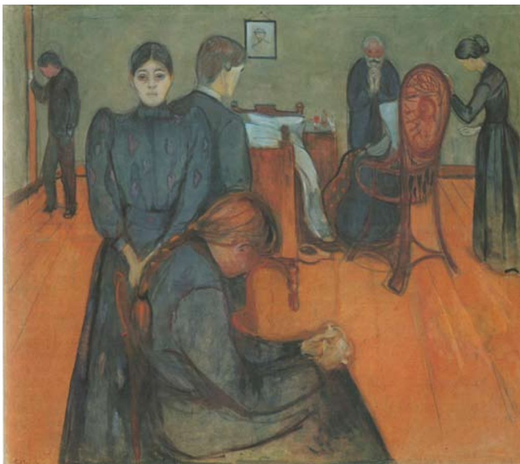
Edvard Munch, Dod i sygeværelset, 1895.

Eller ved at hengive os til ordets mysterium, vil vi få vished for, at evangeliet er noget ganske særligt, hvad vi i øvrigt har en afglans af, når vi bruger sproget i almindelighed. I almindelighed omgås vi ordenes kraft med stor omhyggelighed, hvilket også har med tro at gøre.