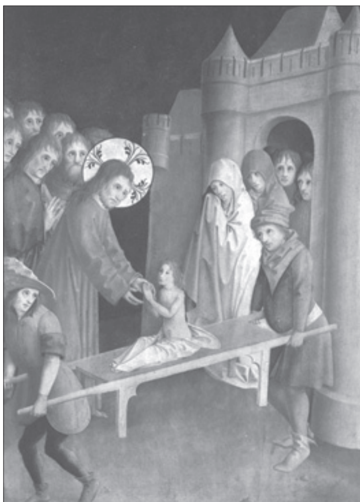
Darmstadt-passionsmesteren, ca. 1440: Opvækkelsen af enkens søn fra Nain.

Den situation griber Jesus ind i. Han ynkedes over enken, hører vi, og alene denne bemærkning er et tegn på det nye fællesskab, som er under indstiftelse. Normalt udgår der kun fællesskab