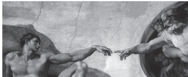
... MERE END NATUR. GUD SKABER ADAM AF MICHELANGELO.

Nu er der ingen tvivl om, at mennesket er natur, og derfor er der heller ingen tvivl om, at kærligheden er natur. Vi deler natur med dyrene og med planterne, for så vidt som der foregår processer i menneskets legeme, der kan genfindes i plante- og dyreverdenen. Vi er desuden en del af det store økologiske kredsløb, ja vi indgår i intet mindre end universets åndedrag og deler altså skæbne med alt andet levende. Vi deler endda i visse henseender lidenskab med dyrene. I den forstand er vi som brødre og søstre i forhold til alt levende. Vi reagerer derfor også som