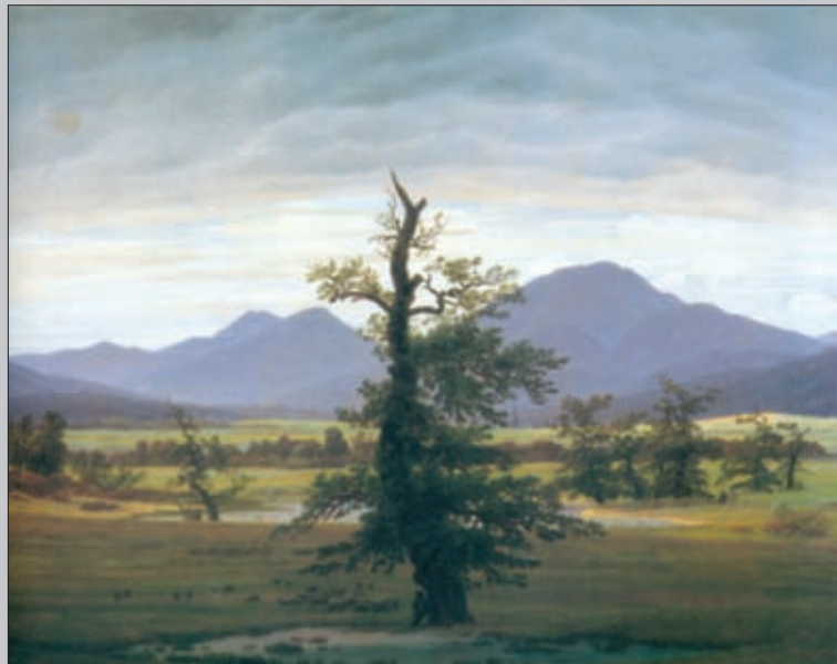
NATUR... (Caspar David Friedrich: Enligt træ, 1821)