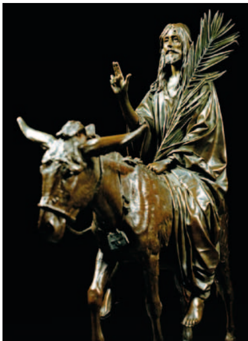
Jean Léon Gérôme (1824-1904): "Christ entering Jerusalem".

derfor har vi brug for at høre og forstå hver eneste detalje i den hellige historie, for det kan jo være netop dagens detalje, som vi end ikke vidste, at vi har brug for at høre. Historiens hellighed er blandt andet, at den altid har virkningskraft, at den altid kan finde en vej til hjertet, hvilken tilstand dette end måtte befinde sig i.