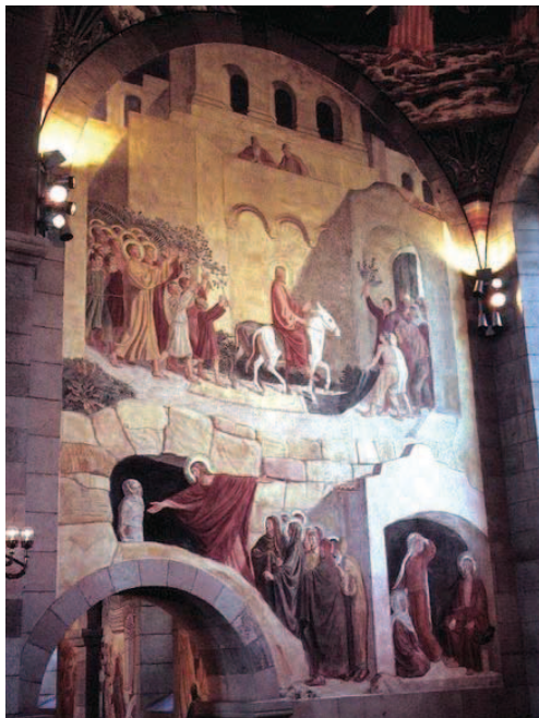
Viborg Domkirke: "Indtoget i Jerusalem".

Det er selvfølgelig en god idé at tale med andre om snart sagt alting. Det er godt at drøfte, diskutere, indhente viden, bruge sin forstand, og hvis man ikke har nogen, så gøre brug af andres. Vi har gjort en sådan adfærd til en politisk hovedhjørnestein i Danmark. Vi kalder den demokrati eller det samarbejdende folkestyre, men nedenunder denne politiske organisering, skal vi kunne se og høre det enkelte individ, der løfter sit hjerte til Gud, for at bede om mere tro; det individ, som har lært, at helliggørelse ikke er noget, mennesker finder sammen om, og som sker, fordi mennesker stifter fællesskab, men fordi Gud i hjertets skjul handler med hver enkelt af os. Dette kan vi selvfølgelig godt være enige om at mene og i den