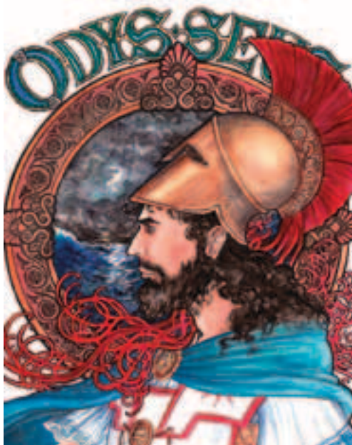
Lords Shadowblade, Odysseus.

Odysseus, den græske sagnhelt, kom virkelig hjem efter tyve års krig og omflakken, og derhjemme gjorde han kort proces med de bejlere, som belejrede hans kone og åd hans hus op. Han er en helt, ikke alene fordi han klarer så mange strabadser undervejs, men også fordi han netop kommer hjem. Herefter hører vi ikke mere om Odysseus, for nu er han jo kommet hjem, og der er ikke mere at fortælle. Selv har han uendelig meget at fortælle dem, som vil høre på ham, og det ville og vil mange, men det vil være de samme historier, han fortæller, indtil han som olding lukker sine øjne; med mindre han drager afsted igen, for at komme hjem endnu engang. På baggrund af bl.a. Odysseus' historie siger vi af og til, at meningen med at rejse er at vende hjem igen. Først når man er brudt op fra noget, kan man værdsætte, hvad man forlod, og finde tilbage igen. Hjem til Ithaka eller blot til barndommens gade. Hvad enten man, som Odysseus, har en klar forestilling om, hvad man skal hjem til, og hvor man hører hjemme, eller man er mere moderne og netop har svært ved at høre til et bestemt sted, så er forestillingen om et hjemme ikke til at slippe af med, en forestilling, som før eller siden vil ytre sig som længsel, rastløshed eller en vilje til at bevare, hvad man har.