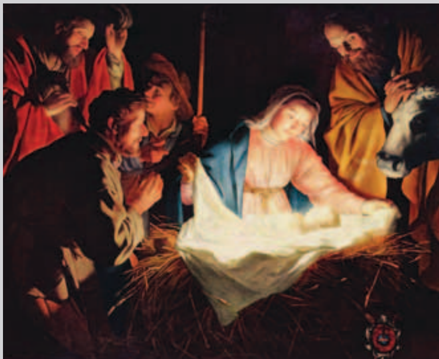
Gerard van Honthorst.