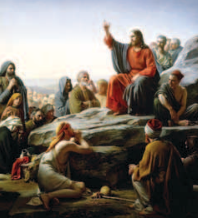
Carl Bloch, Sermon on the Mount.

længsel, som rækker udover denne verden og kun kan finde hvile i Gud. Men som en begyndelse mærker de ikke andet end skuffelse og vrede.